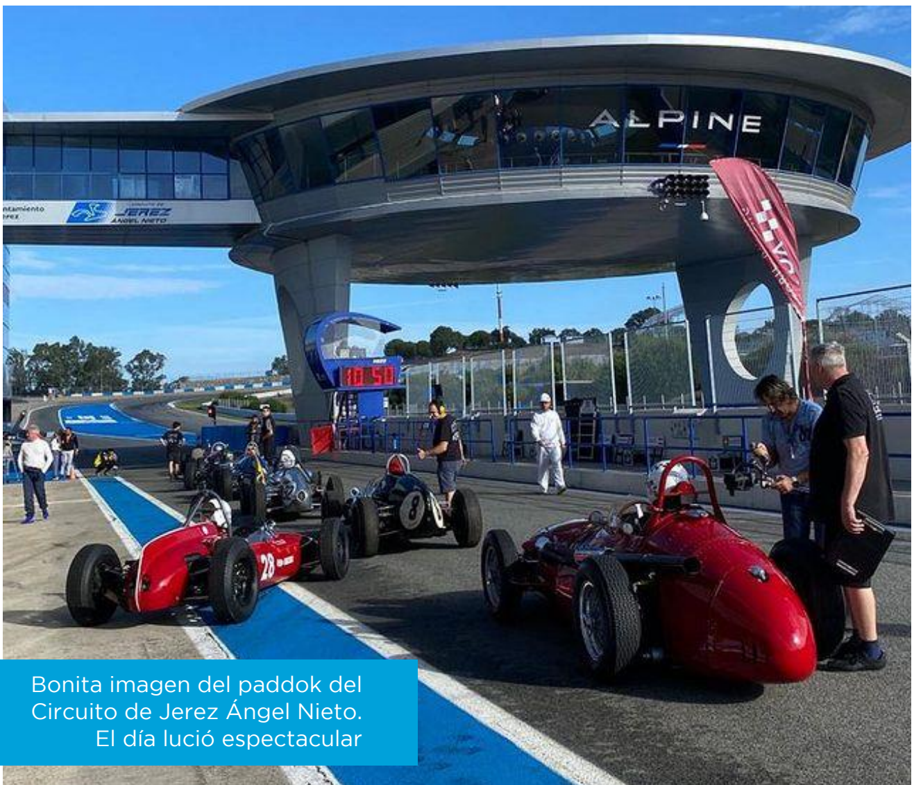
Bonita imagen del paddok del Circuito de Jerez Ángel Nieto. El día lució espectacular